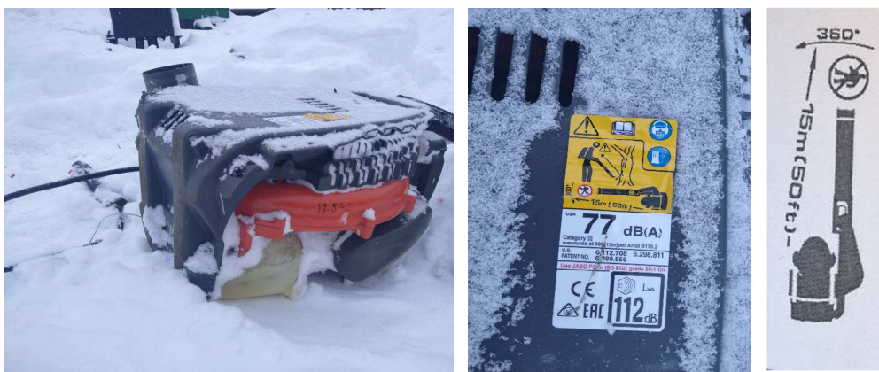
5.att. Benzīna lapu pūtējs Husqvarna 580BTS

Darbu veicējs pārmijas attīrīšanai no sniega lietojis benzīna lapu pūtēju Husqvarna 580BTS (skat. 5.att.)