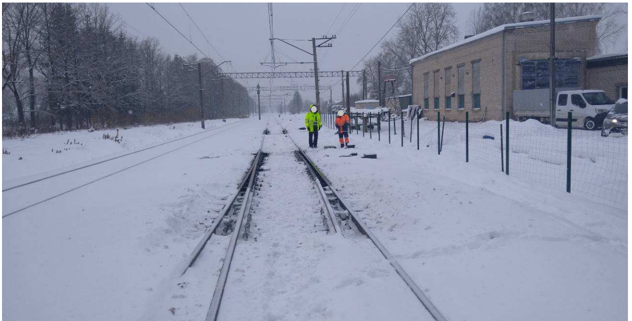
4.att. Laikapstākļi negadījuma vietas apskates laikā (foto uzņemts negadījuma dienā ap plkst. 14.00)

Aktuālā situācija ar laikapstākļiem dabā parādīta 4. att.