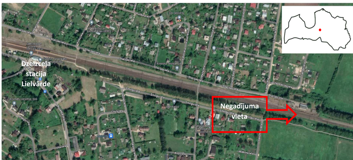
1.att. Negadījuma vieta

Negadījums notika 2023. gada 30. novembrī plkst. 10.14 Lielvārdes dzelzceļa stacijā pie pārmijas Nr. 3 (sk. 1. - 3.att.). GPS koordinātas (apt.) - 56.720423, 24.822438 (Google maps).